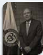
GUILLERMO BOTERO MINISTRO DE DEFENSA