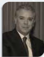
IVÁN DUQUE PRESIDENTE DE LA REPÚBLICA