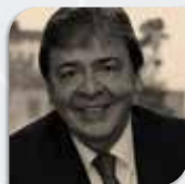
CARLOS HOLMES TRUJILLO CANCILLER