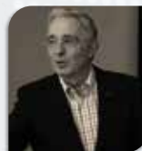
ÁLVARO URIBE VELEZ SENADOR DE LA REPÚBLICA